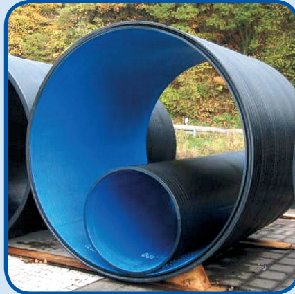
Coextrudierte Innen- und Außenfläche aus Sondermaterialien

Rohrleitungen können durch die Coextrusion z.B. mit einer inspektionsfreundlichen Innenschicht gefertigt werden. In explosionsgefährdeten Bereichen kann sowohl die Innenschicht als auch die Außenschicht aus einem leitfähigen Material produziert werden.